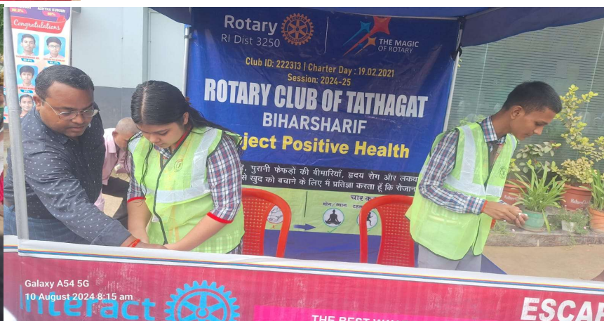
Galaxy A54 5G 10 August 2024 8:15 am