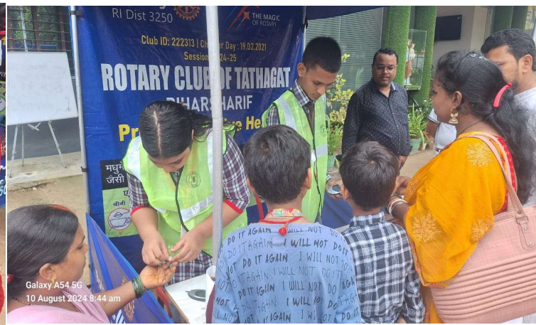
Galaxy A54 5G 10 August 2024 8:44 am