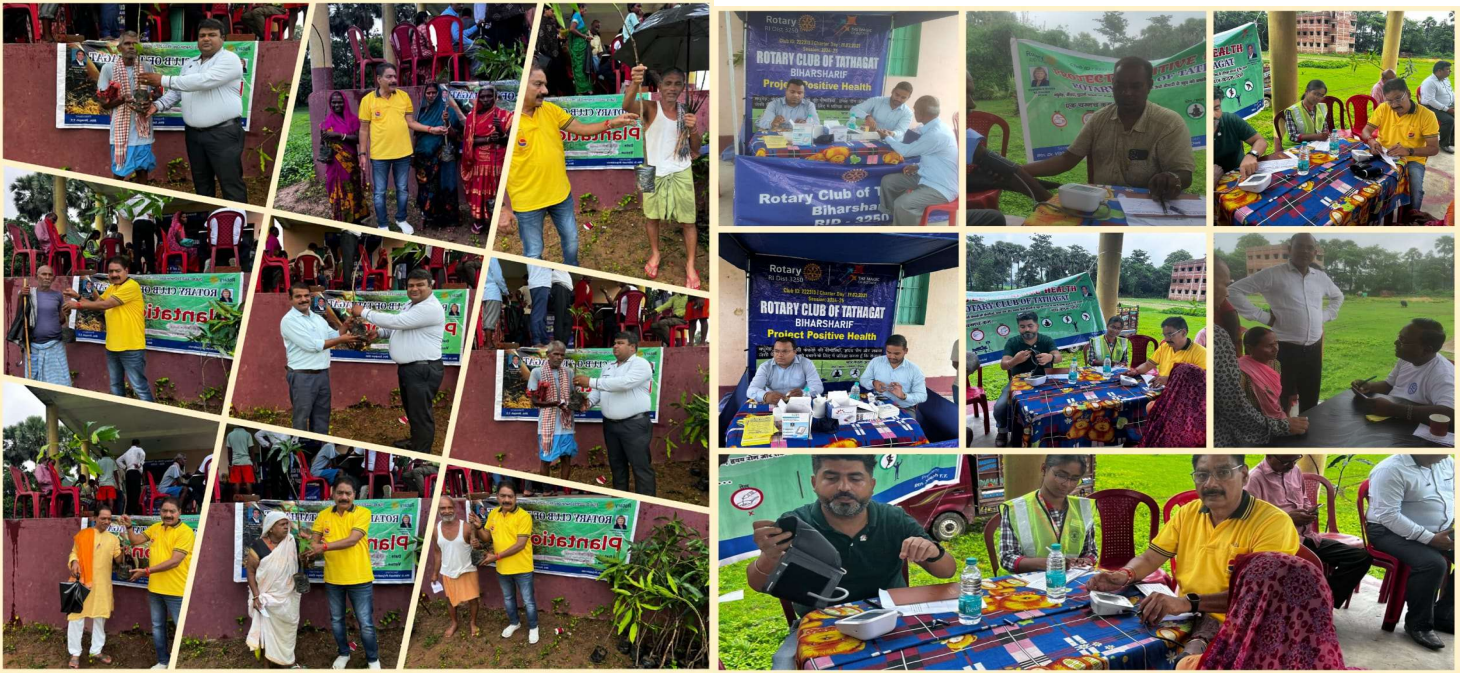
Distribtuion of Mango Saplings