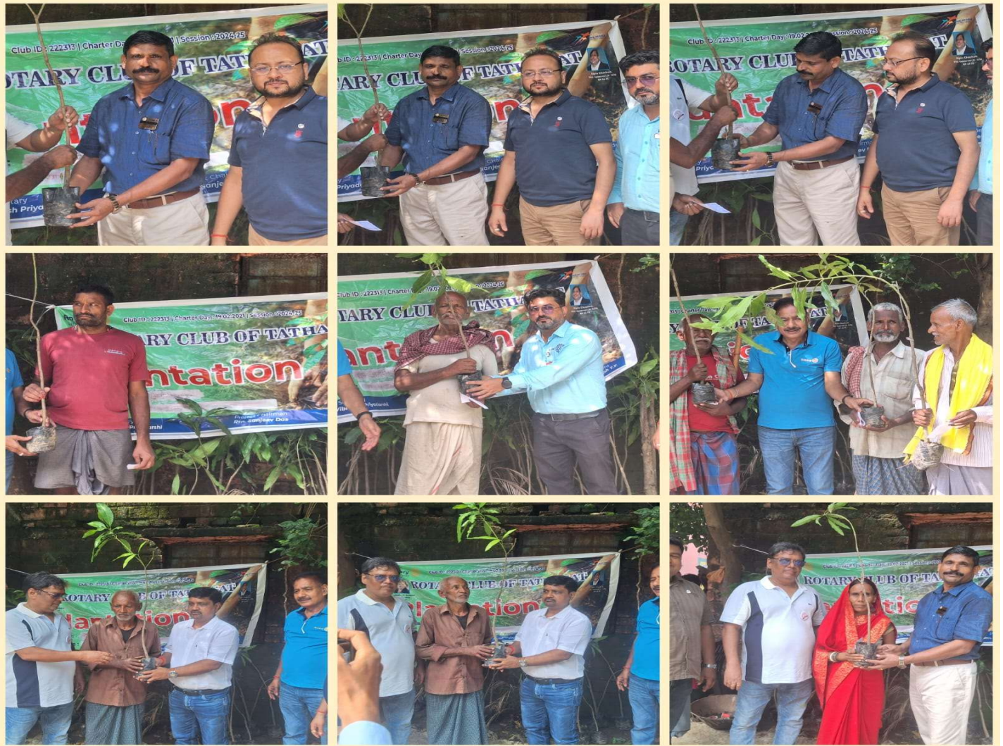
Distribution of Mango Saplings