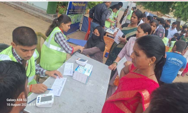
Galaxy A54 5G 10 August 2024 8:14 am