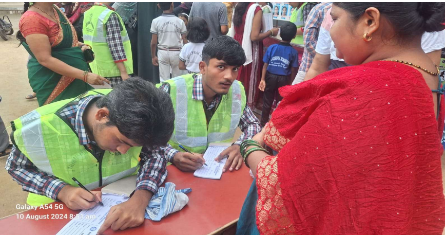
Galaxy A54 5G 10 August 2024 8:51 am