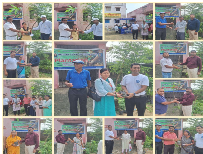
Distribtuion of Mango Saplings