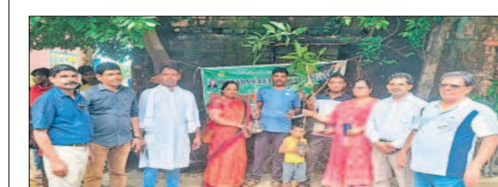
मोकामा के करारा गांव में रविवार को चलो गांव चले अभियान के तहत पौधे बांटे जाते हैं।