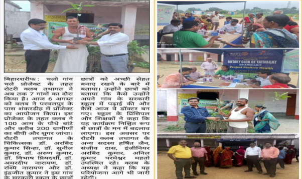
बिहारशरीफ: चलो गांव चले प्रोजेक्ट के तहत रोटरी क्लब तथागत ने अब तक 7 गांवों का दौरा किया है। आज 6 अगस्त को क्लब ने परवलपुर के पास शंकरझीह में प्रोजेक्ट का आयोजन किया। इस प्रोजेक्ट के तहत कुल 100 आम के पौधे बांटे और करीब 200 ग्रामीणों का बीपी और शुगर जांचा।

07 अगस्त 2024, बुधवार, बिहारशरीफ के प्रकाशित