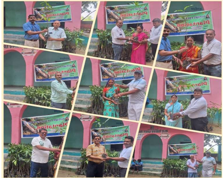
Distribtuion of Mango Saplings