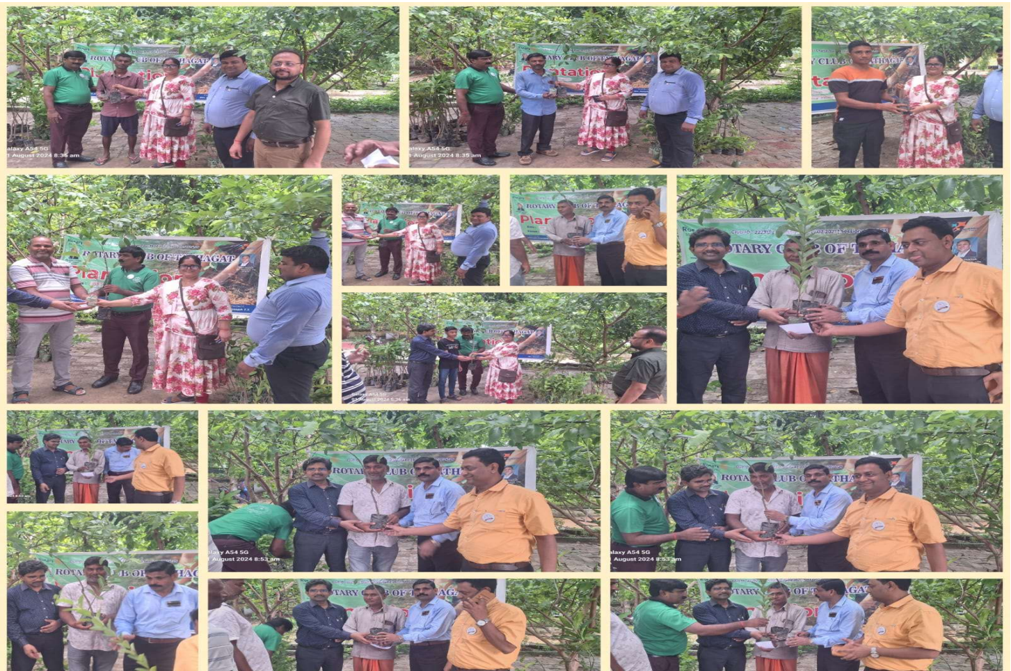
Distribution of Mango Saplings